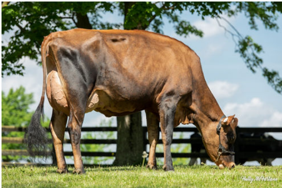
SPRUCE AVENUE VIDEO MONTAGE DAUGHTER