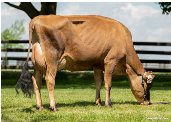
WALKERBRAE VIDEO MAGGIE DAUGHTER